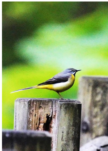
令和2年度 野鳥部門 最優秀賞 「初夏」