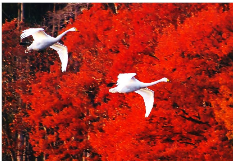
令和2年度 白鳥部門 最優秀賞 「晩秋にようこそ」